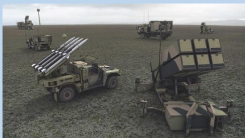
Obrázok 3 Prenosný systém krátkeho/veľmi krátkeho dosahu (VSHORAD/SHORAD MANPAD)